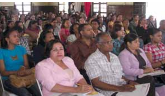
Participantes en el curso en San Francisco de Macorís

El contenido del curso versó sobre diferentes aspectos de la Ley General de Archivos No. 481-08 y su Reglamento de Aplicación, sistemas nacional e institucional de archivos, archivo de gestión, archivo central y los diferentes procesos que prevé la archivística moderna para la eficiente gestión documental.