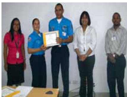
Entrega de certificados en el CESA