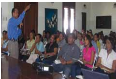
Asistentes al curso en San Pedro de Macorís

En el primer trimestre del año el AGN ha capacitado en Archivística a 260 encargados de archivos de instituciones públicas y pri-