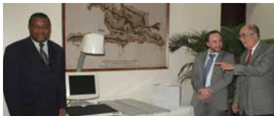
Parte de los equipos donados

A la actividad asistieron funcionarios del AGN, historiadores, investigadores, profesores y público en general.