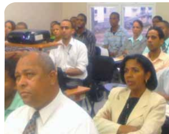
Participantes en el diplomado

Para el buen desarrollo del diplomado se dispone de prácticas archivísticas, aula virtual, material de clases en soporte digital y visita guiada a distintas áreas del AGN.