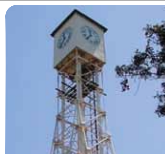
Reloj histórico de Montecristi

Los técnicos del AGN aprovecharon la oportunidad para constatar el estado en que se encuentran importantes documentos de la vida social, política, económica y cultural